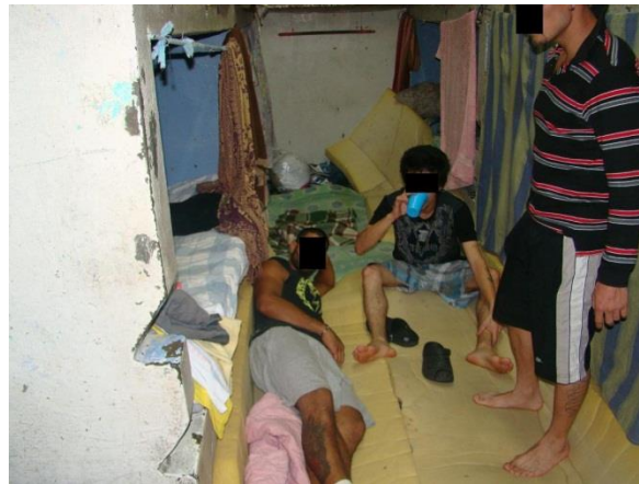
Fotos: personas durmiendo en el suelo dentro de los dormitorios del CPI San José.