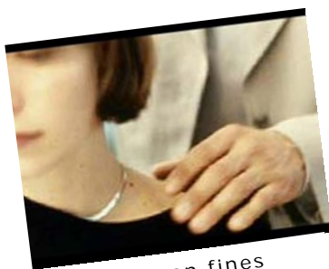
Foto con fines ilustrativos