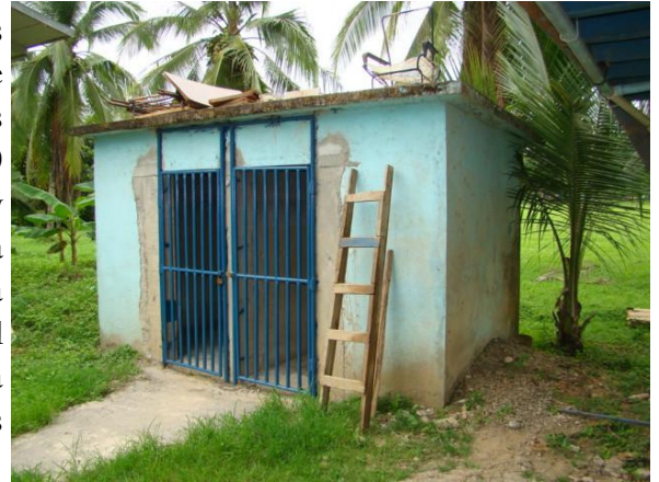
Estas son las celdas de aprehensión de la Delegación de Sixaola.

La Defensoría de los Habitantes comprobó deficientes condiciones de infraestructura e incluso, en algunos casos hasta higiénicas, en más de 50 celdas ubicadas en delegaciones y subdelegaciones de la Fuerza Pública de todo el país, situación que amerita la intervención progresiva del Ministerio de Seguridad Pública para mejorar el estado de dichas instalaciones.