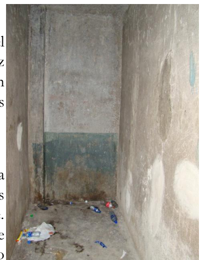
Las celdas de la Delegación de Puntarenas centro no cuentan con una estructura para que las personas aprehendidas duerman o se sienten.

-Cama de concreto: Las personas que son aprehendidas y llevadas a las celdas de la Fuerza Pública deben pasar como máximo 24 horas, razón por la cual todas las celdas deben contar con una cama de concreto, sea para dormir o para sentarse. Con respecto a este requerimiento, la Defensoría ha venido llamando la atención de las autoridades ya que la mayoría de las celdas de Fuerza Pública visitadas no cuentan con una estructura para que la persona descanse, por lo que deben permanecer en el suelo. Esta situación se observó en delegaciones como: Pavas, el Guarco de Cartago, Mora, Cahuita, Palmares, San Sebastián, Talamanca y San Diego de la Unión.