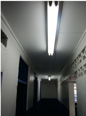
Las celdas de la Delegación de Chacarita solo cuentan con luz artificial en los pasillos.