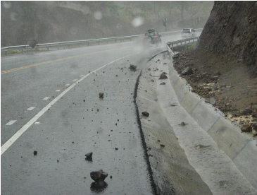
En una inspección realizada en abril, profesionales de la Defensoría constataron el desprendimiento de piedras.

La Defensoría de los Habitantes llamó fuertemente la atención al Consejo Nacional de Concesiones y al Ministerio de Obras Públicas y Transportes para que procedan a intervenir, de manera inmediata, efectiva y permanente, las acciones que permitan exigirle a la empresa concesionaria todas las medidas de mitigación necesarias y suficientes para garantizar la seguridad de las y los conductores que transitan en la nueva vía hacia Caldera.