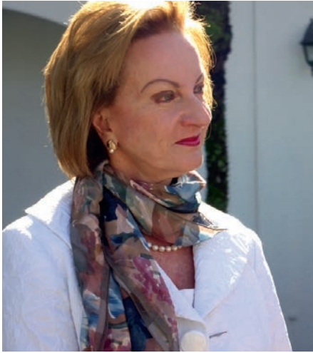
Ofelia Taitelbaum Yoselewich Defensora de los Habitantes de la República

Tener la posibilidad de compartir con ustedes la rendición de cuentas de mi periodo como Defensora de los Habitantes 2009-2013 en las causas de defensa y promoción de los derechos de las mujeres y, a la vez, tener la posibilidad de presentar y con ello consolidar esta segunda edición la Revista "Humanas" –como primer medio especializado en la institución en temas de género- es sin duda una gran satisfacción personal e institucional.