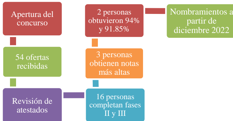
Figura n°2: Proceso de incorporación del personal en Auditoría Interna.