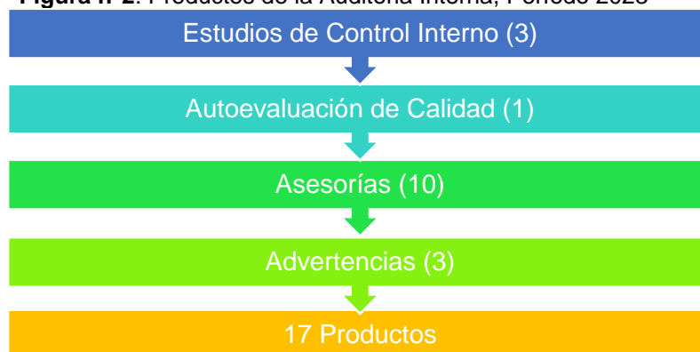
Figura n°2: Productos de la Auditoría Interna, Período 2023