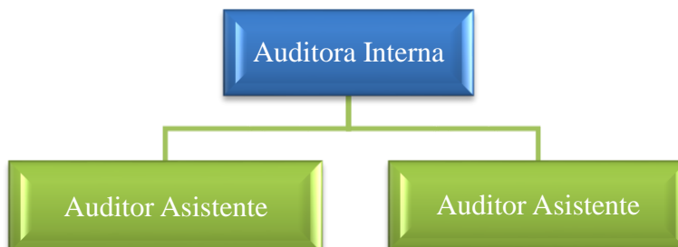
Figura n°1: Organigrama de la Auditoría Interna